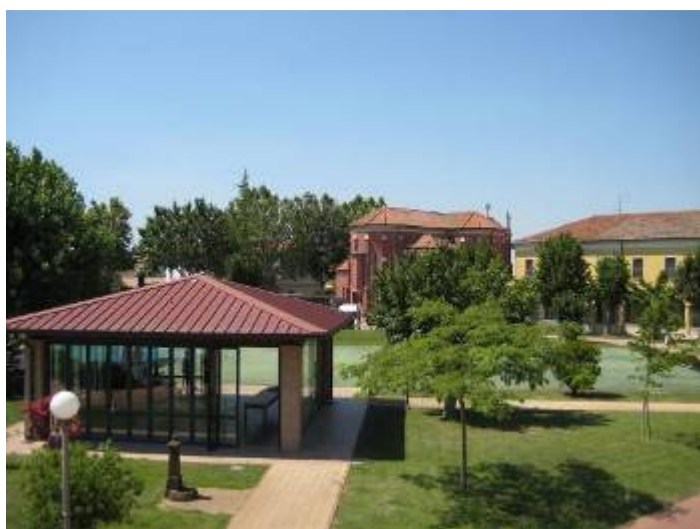
Il cortile interno