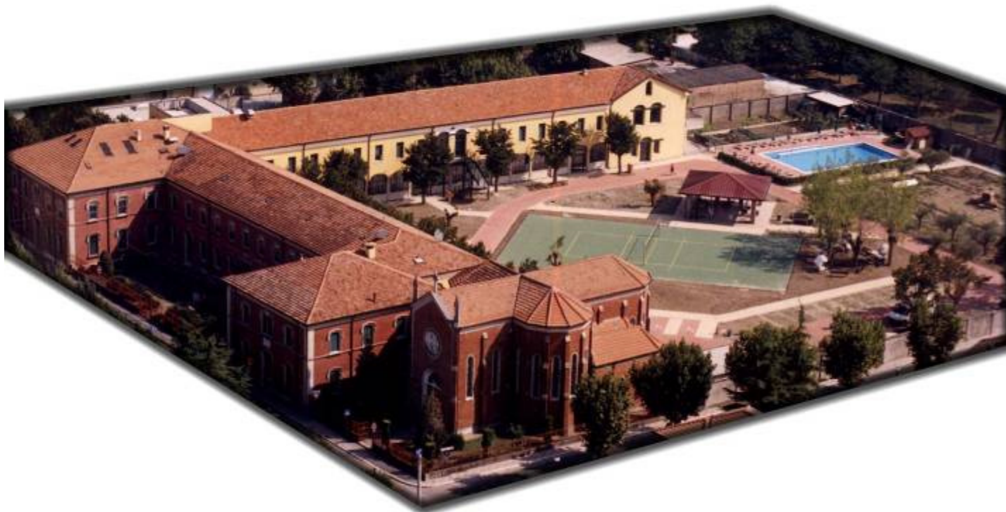
la Casa vista dall'alto

L'Istituto don Ghinelli, Opera don Guanella, è un complesso vasto che offre al territorio una serie di servizi in favore delle persone disabili. La Casa si ispira al Progetto Educativo Guanelliano al quale fanno riferimento ideale e operativo tutte le servizi attivi al suo interno (CSR, CSRR, GA).