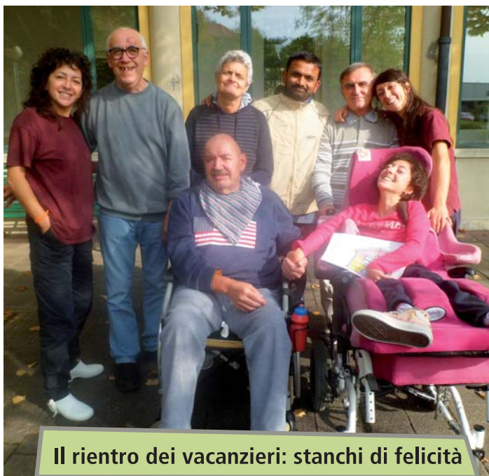
Il rientro dei vacanzieri: stanchi di felicità