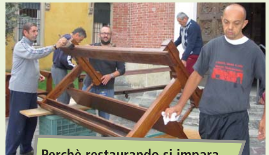
Perchè restaurando si impara...