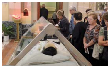
Il vero bisogno