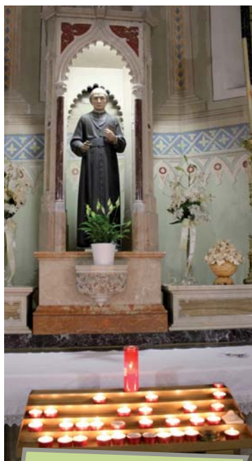
L'altare di San Guanella