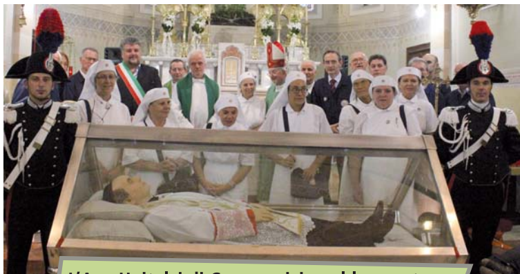
L'Ass. Unitalsi di Cesena vicino al loro patrono