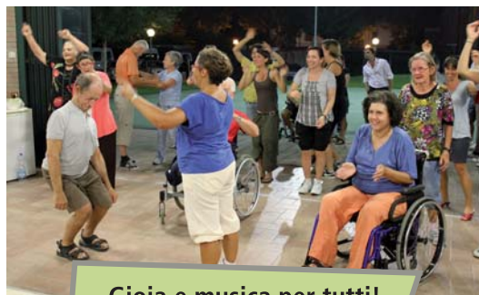
Gioia e musica per tutti!

23.07 Nuovo computer al don Ghinelli grazie alla beneficenza delle "Gazzelle in Vespa" di Cesenatico.