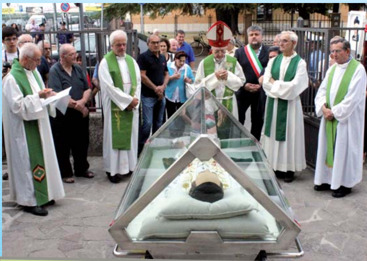
L'accoglienza di Mons. Lino Garavaglia e la comunità locale

Noi ci siamo. Non è scontato. Nè qui nè altrove. Un istante e poi il coro di chi resta potrà recitare salmi di meraviglia. Come se morire fosse una sorpresa: eccezione alla regola di un restare perenne. C'è del vero in questo pensare, c'è il desiderio che il tempo continui. Lo crediamo, anche chi non crede, perché la vita vuole essere per sempre. E se chi è partito lo abbiamo amato davvero, ci sembra di vederlo ancora, da lui ci sentiamo accompagnati, proprio come quando era vivo, prima di andare. Forse non è bene ricordare tutto, può essere una malattia. Ma ricordare nulla è un peccato; dimenticare è il primo e il più grave dei peccati. Che c'è stato chi ci ha fatto volare da bambini, cambiando la paura in allegria, che nulla abbiamo meritato ma che comunque tutto abbiamo avuto. C'è da ricordare chi è vissuto troppo poco per avere una storia da lasciare, e chi non ha avuto testimoni. Non abbiamo bisogno di tanti giorni comandati per ricordare: ogni giorno possiamo sentirci dentro il risorgere dei nostri cari. Si perché la vita in Cristo è già risorta; nulla del nostro tempo e della nostra esistenza va perduto, nulla è vuoto e privo di senso. Abbiamo la forza di dire: noi ci siamo, ci siamo a ricordare al Padre della vita voi e i vostri cari.