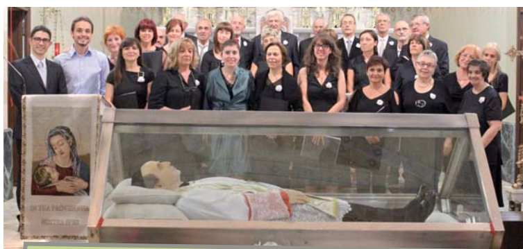
Le voci angeliche del Coro Magnificat di Savignano (Fc)