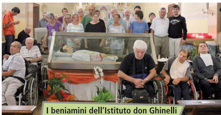
I beniamini dell'Istituto don Ghinelli