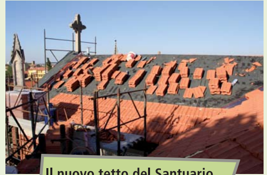
Il nuovo tetto del Santuario...

In attesa del Fondatore abbiamo ristrutturato il nostro Santuario iniziando dal tetto. L'ingresso e le panche sono state restaurate dagli operatori con la collaborazione e la supervisione dei nostri ragazzi!