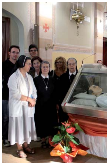
Le suore Maestre Pie di Gatteo illuminate dal Fondatore

Tanti sono stati gli amici e i gruppi che hanno visitato e reincontrato San Guanella: vi mostriamo le foto di alcuni di loro, non ce ne vogliono gli esclusi, di certo non li dimenticheremo!