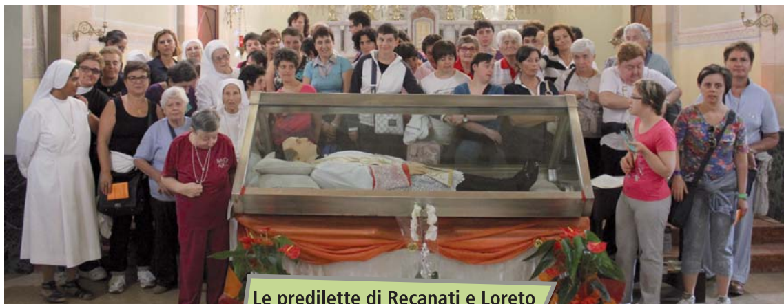
Le predilette di Recanati e Loreto