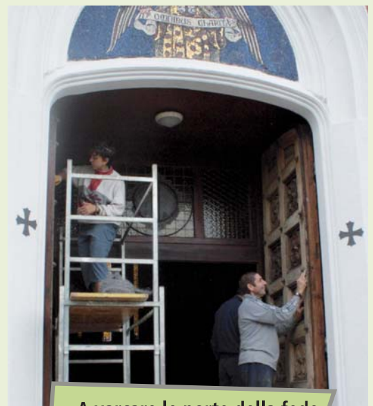
... A varcare le porte della fede