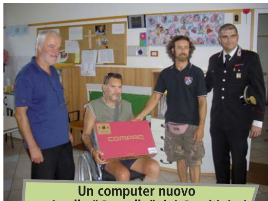
Un computer nuovo grazie alle "Gazzelle" dei Carabinieri