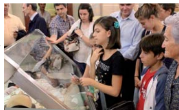
In preghiera vicino al Santo