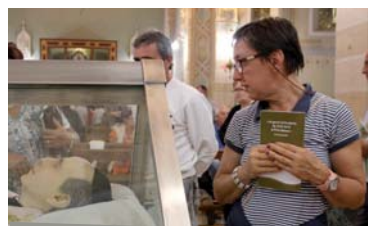
I perché di Monica